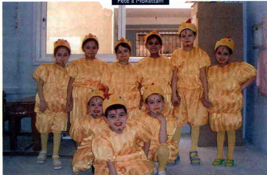
Fête à Mokattam

Petit à petit, le changement s'opère et les conditions de vie s'améliorent pour le bien de tous.