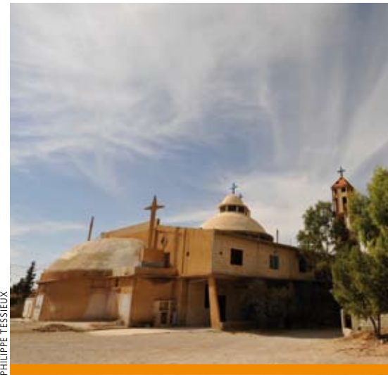
ÉGLISE DE LA PAROISSE DU PÈRE LIANE À AL QAA AU NORD DU LIBAN, PRÈS DE LA FRONTIÈRE SYRIENNE.