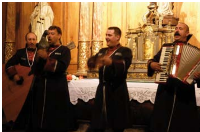
CONCERT DONNÉ PAR L'ENSEMBLE COSAQUE Kouban