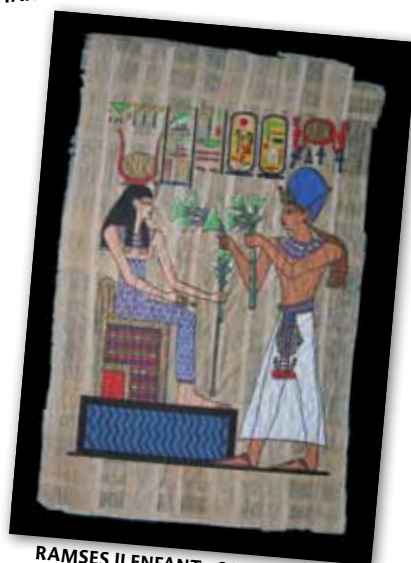
RAMSES II ENFANT - 30 X 19 CM