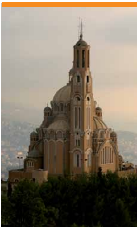
NOTRE-DAME DU LIBAN

Dans le dispensaire de Lydia, nous avons financé l'achat d'une pièce de rechange dans le cabinet médical pour que les soins dentaires restent possibles.