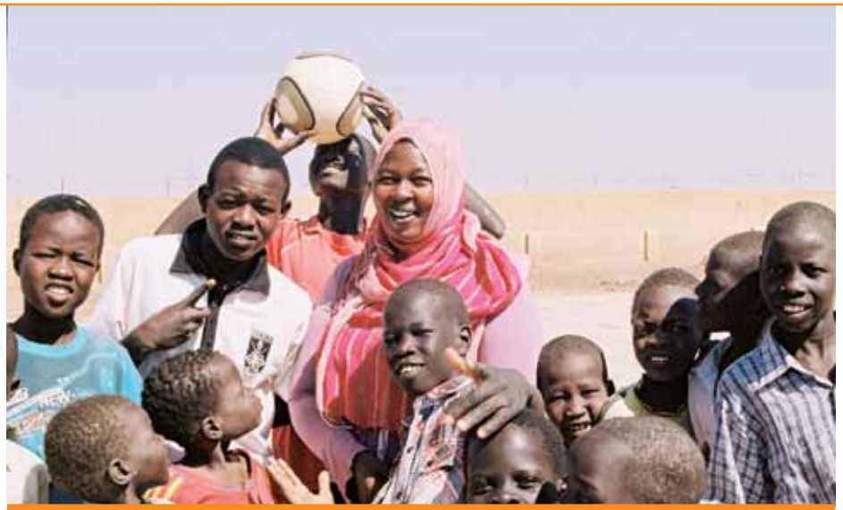
FERME DE DAR JUAN MATHA DECEMBRE 2012

Les 16 centres fonctionnent: 13 d'entre eux distribuent de la nourriture 3 jours par semaine et du lait 5 jours par semaine. Les