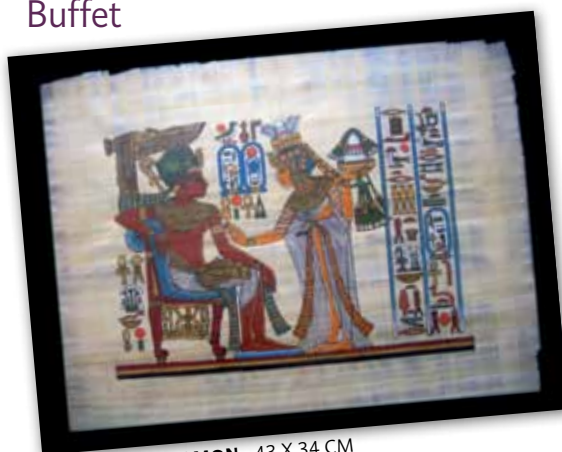
TOUTANKHAMON - 43 X 34 CM