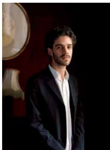
CAROLE BELLAÏCHE © MIRARE