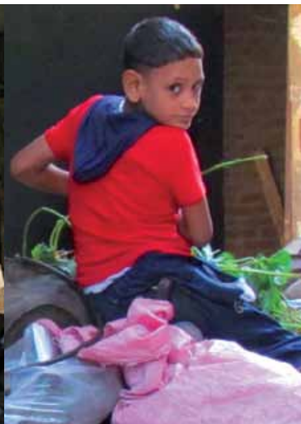
Sur la colline dominant Le Caire, le quartier de Mokattam où vivent les Chiffonniers.