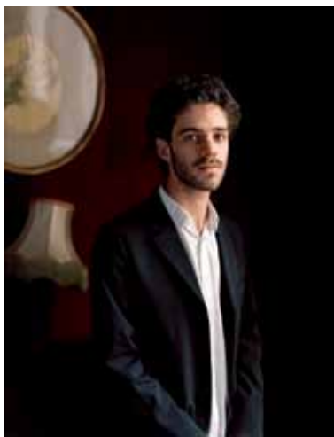
CAROLE BELLAÏCHE © MIRAIRE