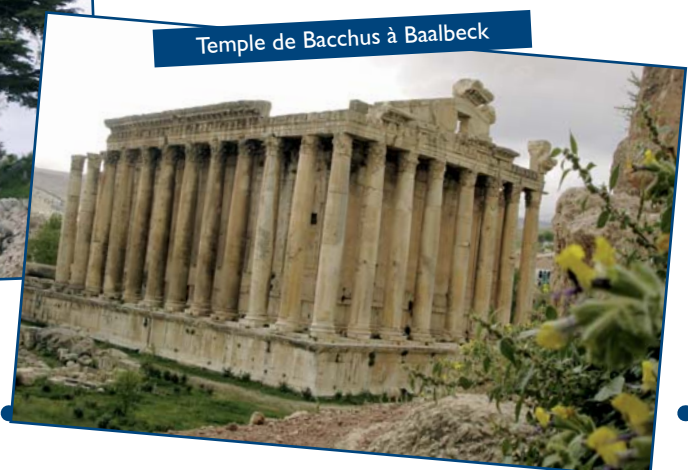
Temple de Bacchus à Baalbeck