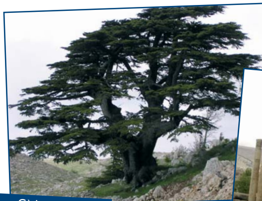
Cèdre du Liban

Réduction pour enfants (de moins de 12 ans, le jour du départ), partageant la chambre de ses parents.