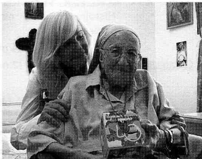
Michèle Torr, Sœur Emmanuelle... et la boîte !