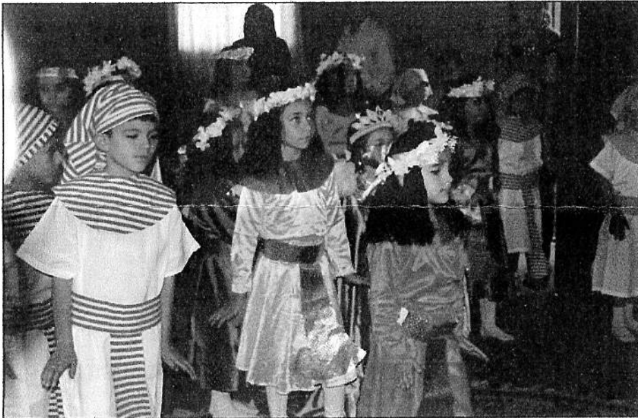
Lors d'une fête à l'école

De même pour les lycéennes et les universitaires qui ont toutes réussi leurs examens ou les passages en classes supérieures.