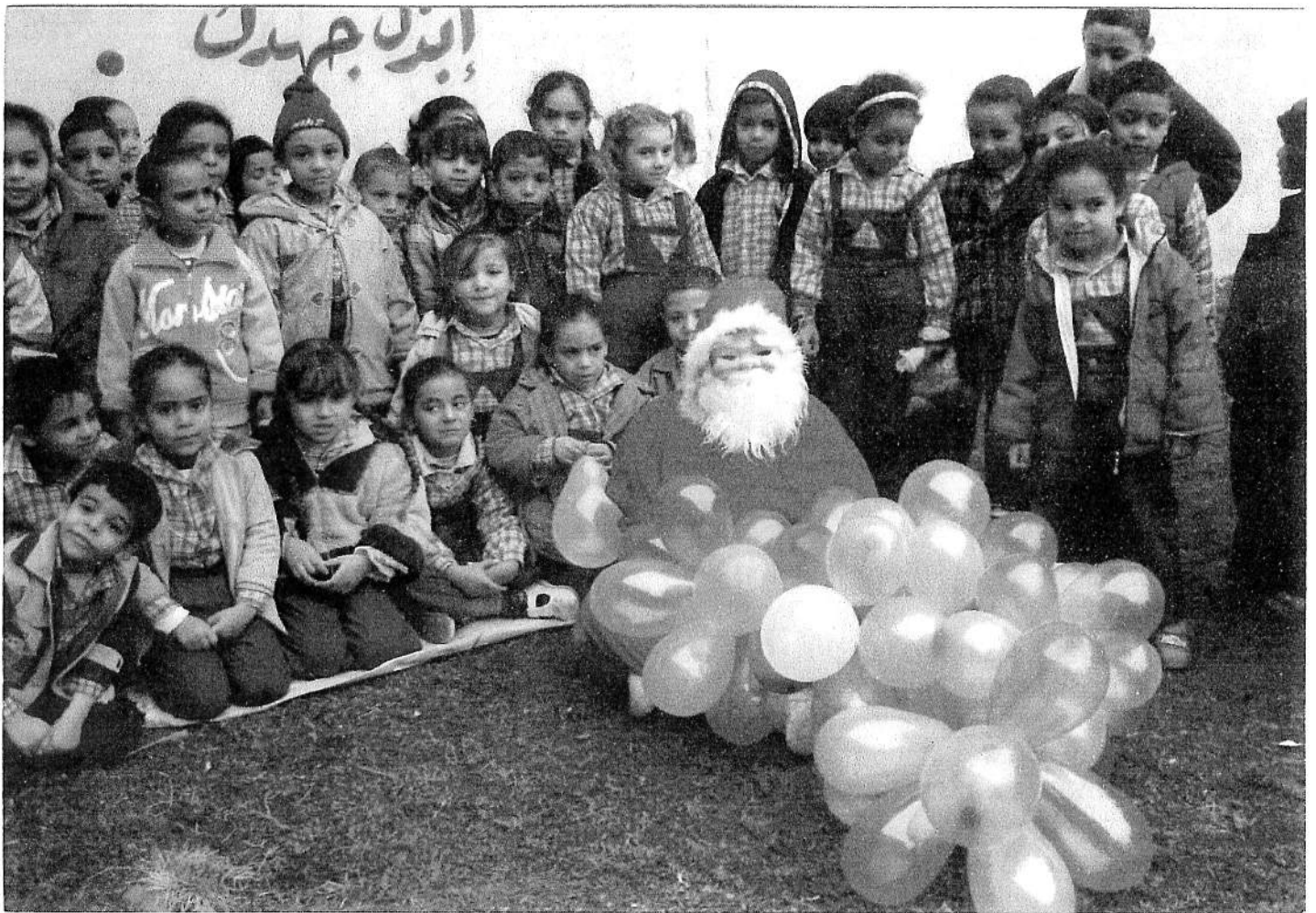
Jardin d'enfants. Noël 2009