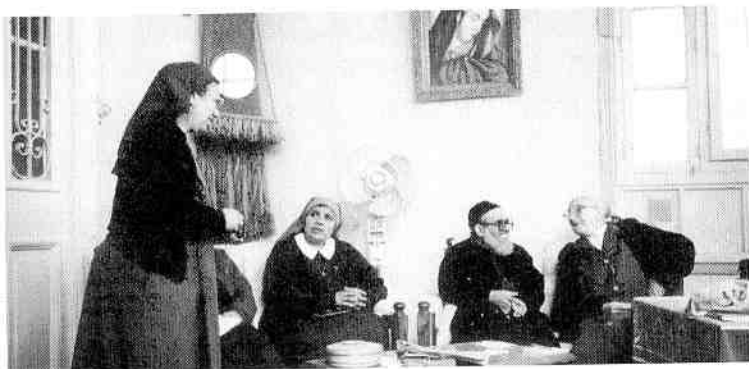
Sœur Sara, Monseigneur Athanasios, Sœur Emmanuelle.