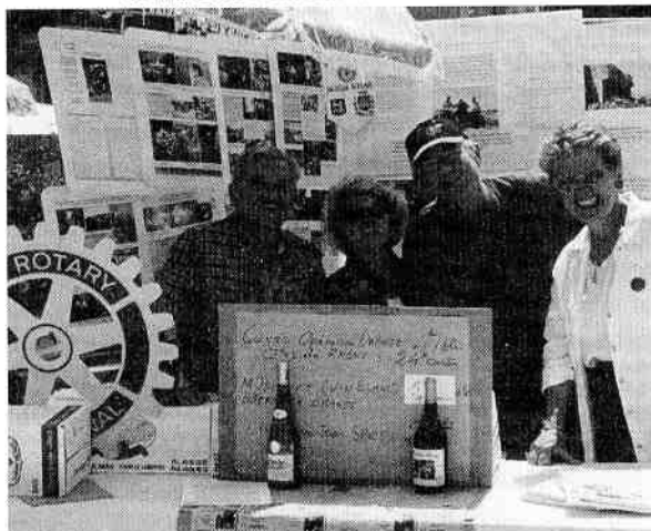
18 mai 2003 : Fête des Associations à Valréas

Le Solstice d'été, la fête de la musique ont été l'occasion pour le relais marseillais d'organiser une soirée dans une belle propriété qui nous a été prêtée gracieusement.